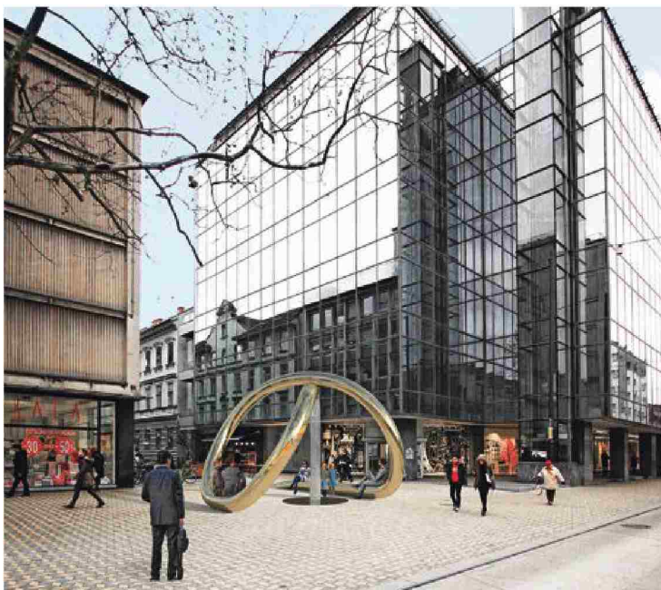
Postavitev vodne skulpture pred Konzorcijem se je zamaknila zaradi kompleksnosti izvedbe. RAČUNALNIŠKI PRIKAZ MOL

evrov naj bi stala postavitev vodne fontane pred Konzorcijem